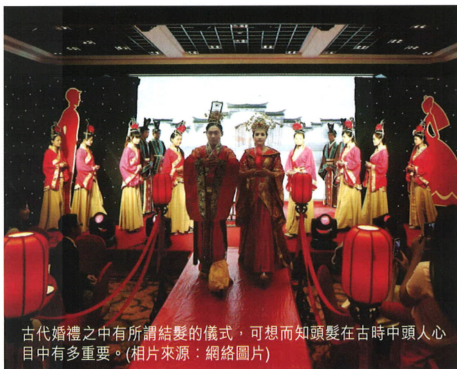
古代婚禮之中有所謂結髮的儀式，可想而知頭髮在古時中頭人心目中有多重要。(相片來源：網絡圖片)

之前我們提過「結髮夫妻」由來另一版本，與此版本分別不大。結髮夫妻的由來還有另一個版本，就是在洞房花燭夜，妻子頭上盤著的髮髻，不能由自己解開，一定要由丈夫親手解開，然後才能洞房成為真正夫妻，於是大凡首次結婚的男女便被稱為「結髮夫妻」了。㊦